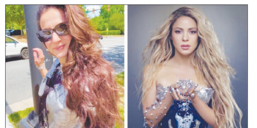
अमीषा पटेल ने बांधे शक्री की तारीफ के पुल

निज संवाददाता : अभिनेत्री अमीषा पटेल इन दिनों सोशल मीडिया पर दो बातों को लेकर काफी चर्चा में हैं। पहली वजह है पांप स्टर शक्री की तारीफ करना और दूसरी वजह है बॉलीवुड के नए कलाकारों पर गुस्सा निकालना। अमीषा ने शक्री की उम्र को लेकर एक पोस्ट सोशल मीडिया पर शेयर किया है, जो फैन्स के बीच चर्चा का विषय बन चुका है। मशहूर सिंगर शक्री ने फीफा विश्व कप 2026 के ऑफिशियल गाने दाई दाई से धमाकेदार वापसी की है। इस गाने में उनके साथ नाइजीरियाई सिंगर बर्ना बांय भी हैं। गाने के एक वीडियो में शक्री पीले रंग के कपड़ों में शानदार डांस करती नजर आ रही हैं, जो सोशल मीडिया पर काफी वायरल हो रहा है। इस वीडियो को अपनी इंस्टाग्राम स्टोरी पर शेयर करते हुए अमीषा पटेल ने लिखा-वाह शक्री, आप 49 साल की उम्र में भी कमाल हैं। आपका डांस, ड्रेस और लुक 25 साल की उम्र से भी ज्यादा हॉट और खूबसूरत है। दूसरी तरफ, अमीषा ने आज के दौर के नए बॉलीवुड कलाकारों और उनके काम करने के तरीके पर तीखा निशाना साधा है। अमीषा का