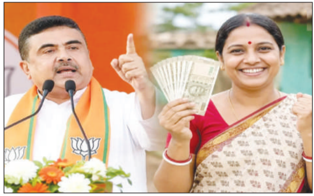
अन्नपूर्णा योजना के 13 पेज के फॉर्म को लेकर फैले भ्रम पर सीएम शुभेंद्रु ने महिलाओं को भरोसा देते हुए कहा कि सरकारी अधिकारी घर-घर जाकर इस योजना का फॉर्म भरने में मदद करेंगे। उन्होंने महिलाओं से कहा-बिल्कुल परेशान मत होइए। हम चाहते हैं कि सिर्फ असली हकदारों को ही मदद मिले।

निज संवाददाता : अन्नपूर्णा योजना के फॉर्म को लेकर महिलाओं के एक समूह में भ्रम है। कई लोग इस बात को लेकर भ्रम में हैं कि 13 पेज का लंबा फॉर्म कैसे भरें। इसको लेकर शनिवार को मुख्यमंत्री शुभेंद्रु अधिकारी ने सभी को भरोसा दिलाया। उन्होंने कहा कि सरकारी अधिकारी घर-घर जाकर फॉर्म भरने में मदद करेंगे। शनिवार को उन्होंने एक सरकारी कार्यक्रम से कहा-बिल्कुल परेशान मत होइए। हमारे लोग घर-घर जाकर फॉर्म भरने में मदद करेंगे। हम चाहते हैं कि सिर्फ असली हकदारों को ही मदद मिले। इससे पहले, महिला और बाल कल्याण मंत्री अग्रिमित्रा पाँल, मंत्री दिलीप घोष और बीजेपी के प्रदेश अध्यक्ष शमिक भट्टाचार्य ने कहा था कि फॉर्म का आसान बनाया जाएगा।