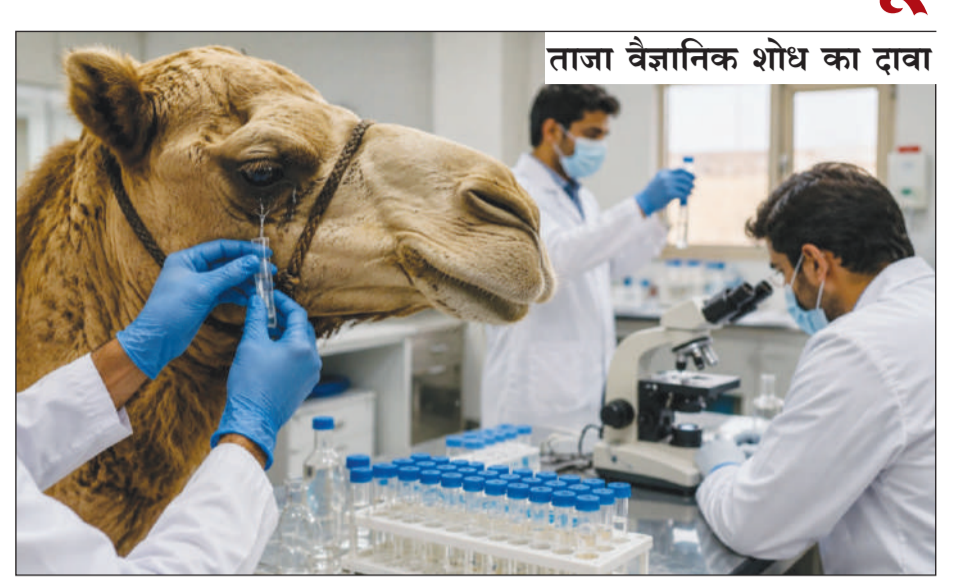
ताजा वैज्ञानिक शोध का दावा

(पेसो) ने साइट पर संपीड़ित हाइड्रोजन गैस के भंडारण और वितरण के लिए जरूरी लाइसेंस जारी कर दिया है। सुरक्षा के लिहाज से हाइड्रोजन संयंत्र और ईंधन भरने वाले पूरे परिसर में अनधिकृत प्रवेश रोकने के पुख्ता इंतजाम किए जाएंगे। साथ ही, हाइड्रोजन रिसाव (लीकेज) और ज्वाला (फायर) डिटेक्टर जैसे सुरक्षा संसरो का नियमित निरीक्षण और सफाई की जाएगी ताकि धूल जमा न हो। इस ट्रेन का रख-रखाव दिल्ली के शकूरबस्ती शोड में किया जाएगा और वहां ले जाने के लिए इसे किसी अन्य इंजन (लोकमोटिव) की मदद से निष्क्रिय अवस्था में खींचा जाएगा। सुरक्षित परिवहन के लिए रेलवे ने बेहद सख्त नियम-कायदे तय किए हैं। इसके तहत ईंधन भरने की प्रणाली की चौबीसों घंटे निगरानी होगी और केवल प्रशिक्षित और प्रमाणित कर्मचारी ही तैनात किए जाएंगे। शुरुआती तीन महीनों तक ट्रेन के सफर के दौरान भी तकनीकी विशेषज्ञ साथ रहेंगे ताकि रास्ते में आने वाली किसी भी समस्या का तुरंत निपटारा किया जा सके।