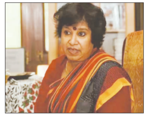
बंगाल में सत्ता परिवर्तन से उत्साहित हैं तसलीमा नसरिन

दो दशकों से, मैं कोलकाता में बसने का सपना संजोए हुए हूँ और अब मैं वहाँ जाकर बसने के लिए पूरी तरह तैयार हूँ। अगर राज्य सरकार मेरी मदद करती है, तो मैं कोलकाता में ही रहूंगी। भाजपा सांसद और प्रदेश अध्यक्ष समिक भट्टाचार्य ने पिछले साल राज्यसभा में उनके इस मुद्दे को उठाया था और गृह मंत्रालय से कोलकाता में उनके रहने की व्यवस्था करने का अनुरोध किया था। तसलीमा ने बताया कि कई संगठनों ने कोलकाता आने के संबंध में उनसे संपर्क किया है, लेकिन उन्हें अभी भी इस बात का कोई अंदाज़ा नहीं है कि वह वास्तव में कब इस शहर की यात्रा कर पाएंगी। जुलाई में, उन्हें एक बंगाली सम्मेलन में शामिल होने के लिए आमंत्रित किया जाना था। लेखिका ने मंगलवार को सोशल मीडिया पर पोस्ट किया कि बांग्लादेश की पूर्व प्रधानमंत्री शेख हसीना जो अभी निर्वासन में हैं को बांग्लादेश लौटने की अनुमति दी जानी चाहिए। भले ही हसीना ने खुद कभी यह नहीं चाहा था कि लेखिका देश लौटें। उन्होंने यह भी महसूस किया कि अवामी लीग पर लगा प्रतिबंध तत्काल हटा दिया जाना चाहिए।